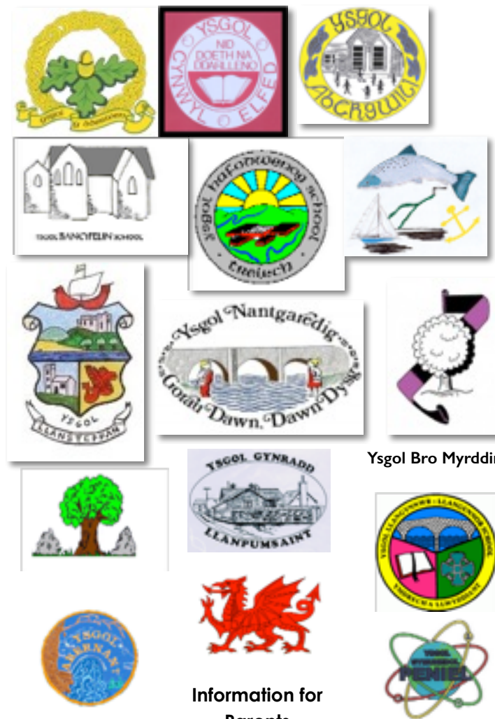
Ysgol Bro Myrddin